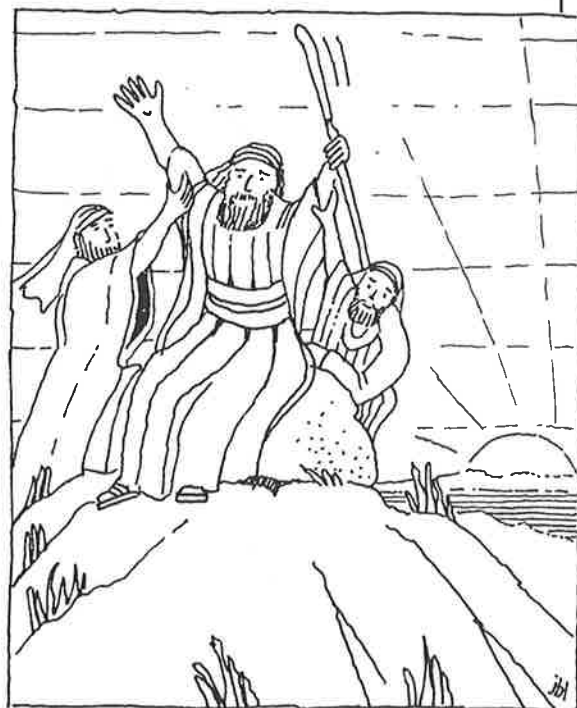
Aäron en Hur ondersteunen Mozes ...