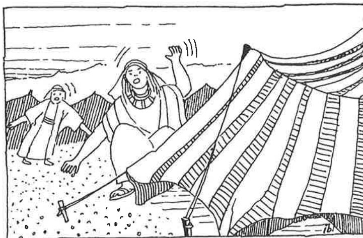
De mensen vinden het manna ...

God zorgde ervoor, dat dit vlak bij de Israëlieten gebeurde.