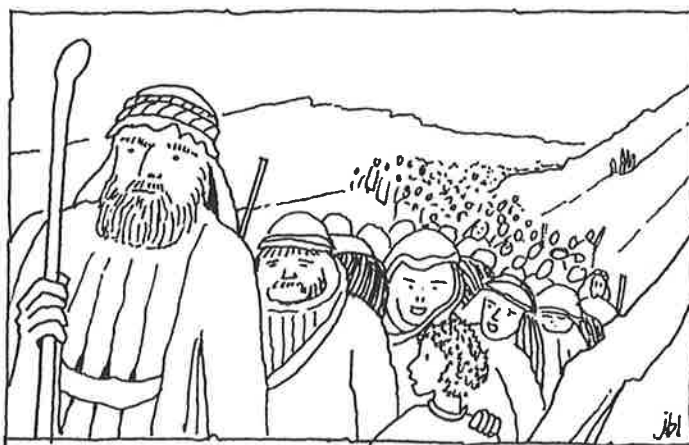
Het volk Israël trekt door de woestijn...