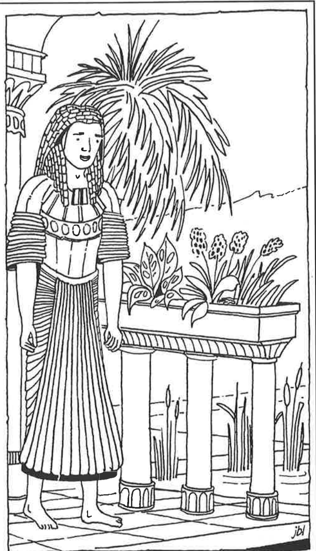
Jozef in dienst bij Potifar ...

De vrouw van Potifar wil dat Jozef haar man wordt. Maar Jozef zegt: 'Hoe zou ik zo een groot kwaad doen en zondigen tegen God?' Wat bedoelt Jozef hiermee?