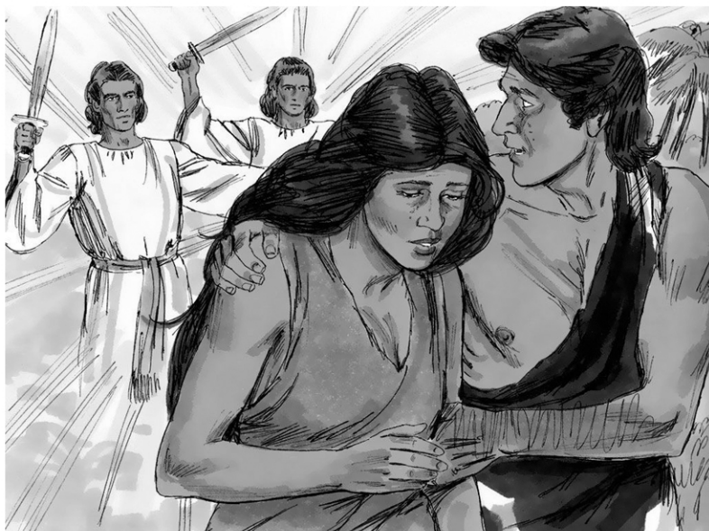
Adam en Eva uit het paradijs weggestuurd ...